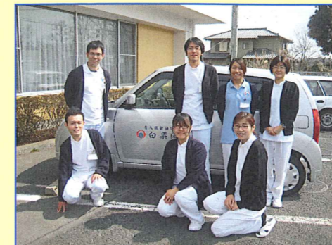
私たちがお手伝いします!!